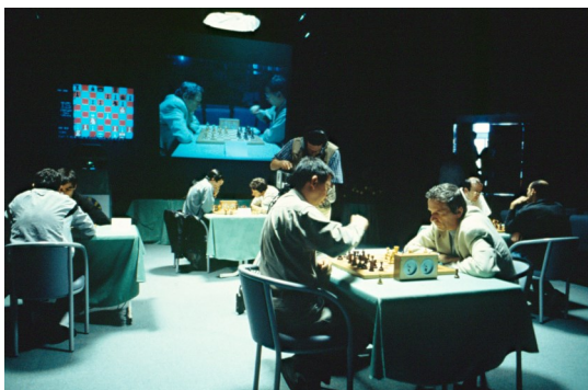
Super finale Comité d'entreprise contre la CCAS

Avec cette deuxième édition, l'identité des Rencontres s'affirme. Les tournois open, de différents niveaux, débütèrent dès le samedi 26 octobre avec un seul jour en double ronde. Baptisés « Grand Prix CCAS » pour le tournoi FIDE, réservé aux joueurs et joueuses classés au-dessus de 2000 Élo, « Tournoi du Cavalier », homologué pour les joueurs entre 1700 et 2100 Élo et « l'Open de l'Avenir », ouvert à toutes et tous dont le classement était inférieur à 1800 Élo. Ces trois tournois open étaient en même temps support pour les phases finales du championnat de France des Comités d'Entreprise et des Rencontres Nationales CCAS. Les phases qualificatives s'étaient déroulées en régions, le 22 septembre. Plus de quatre-cents participants prenaient part à cette journée qui en sept rondes de vingt-cinq minutes par joueur, allait déterminer les équipes qui auraient leur ticket pour le Cap d'Agde.